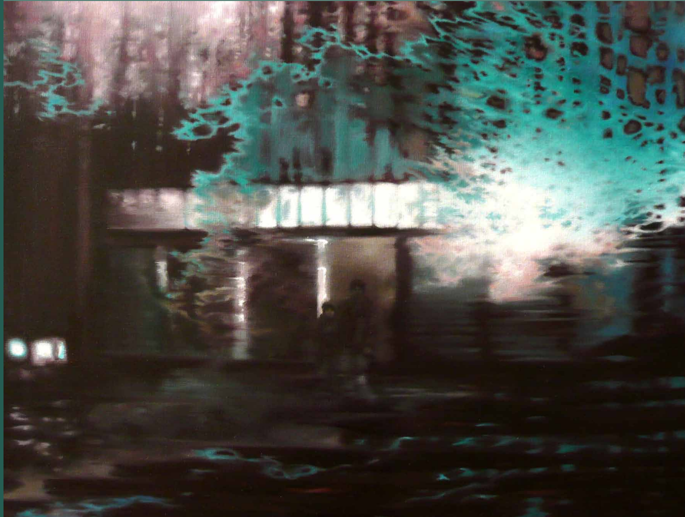
Martin Jagodzinski · Fischerhütte 2009, 50 x 70 cm, Öl auf Leinwand