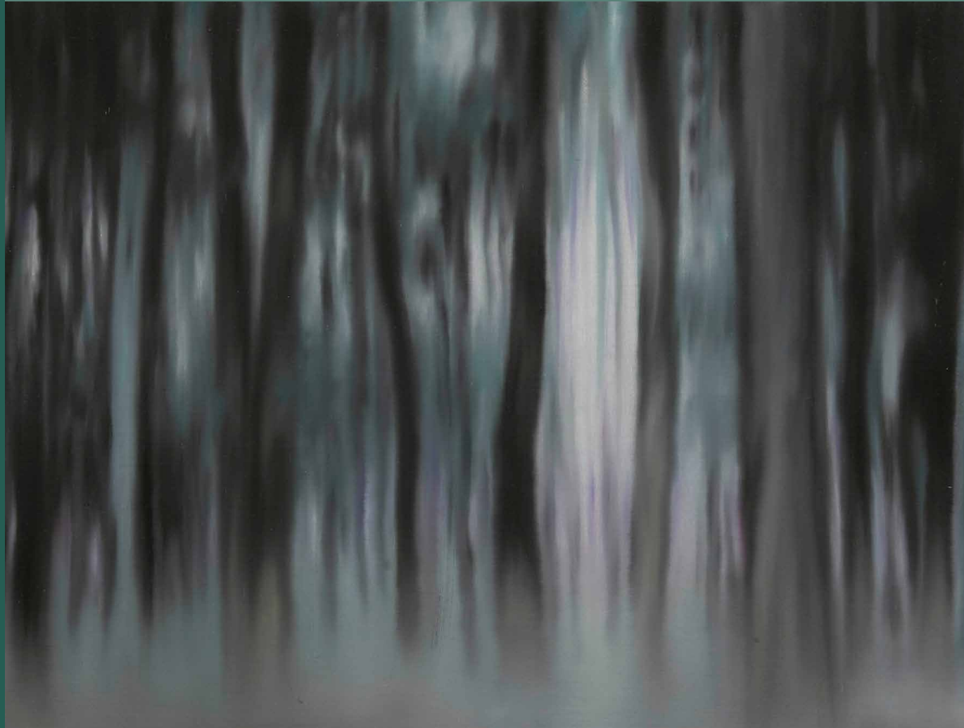
Martin Jagodzinski · Fürstenwalde 2008, 30 x 40 cm, Öl auf Leinwand