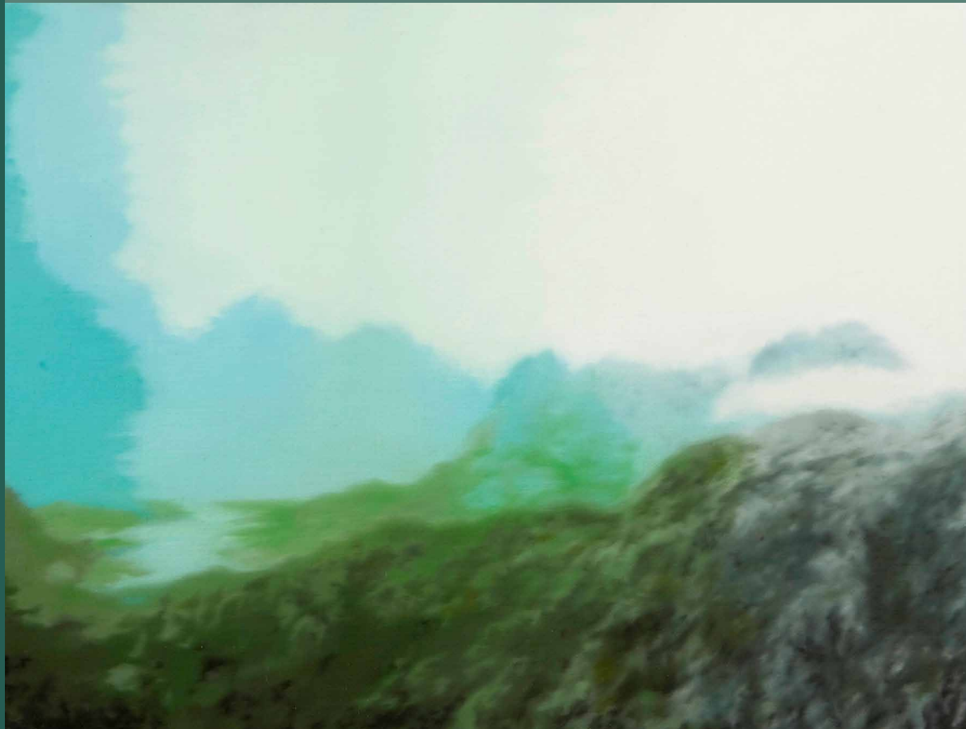
Martin Jagodzinski · Nordische Landschaft (Morgen) 2006, 30 x 40 cm, Öl auf Leinwand