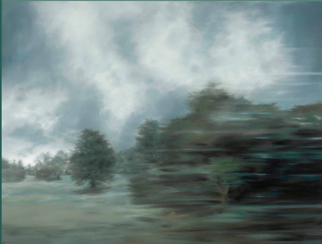
Martin Jagodzinski · Parklandschaft 2006, 63 x 83 cm, Öl auf Leinwand