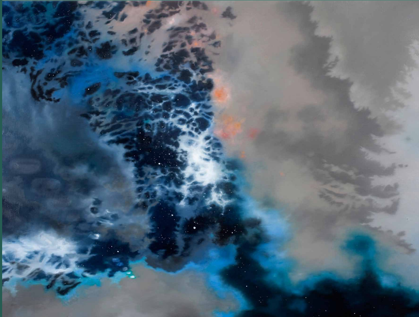
Martin Jagodzinski · Das verborgene Wissen der Sterne 2009, 62 x 83 cm, Öl auf Leinwand