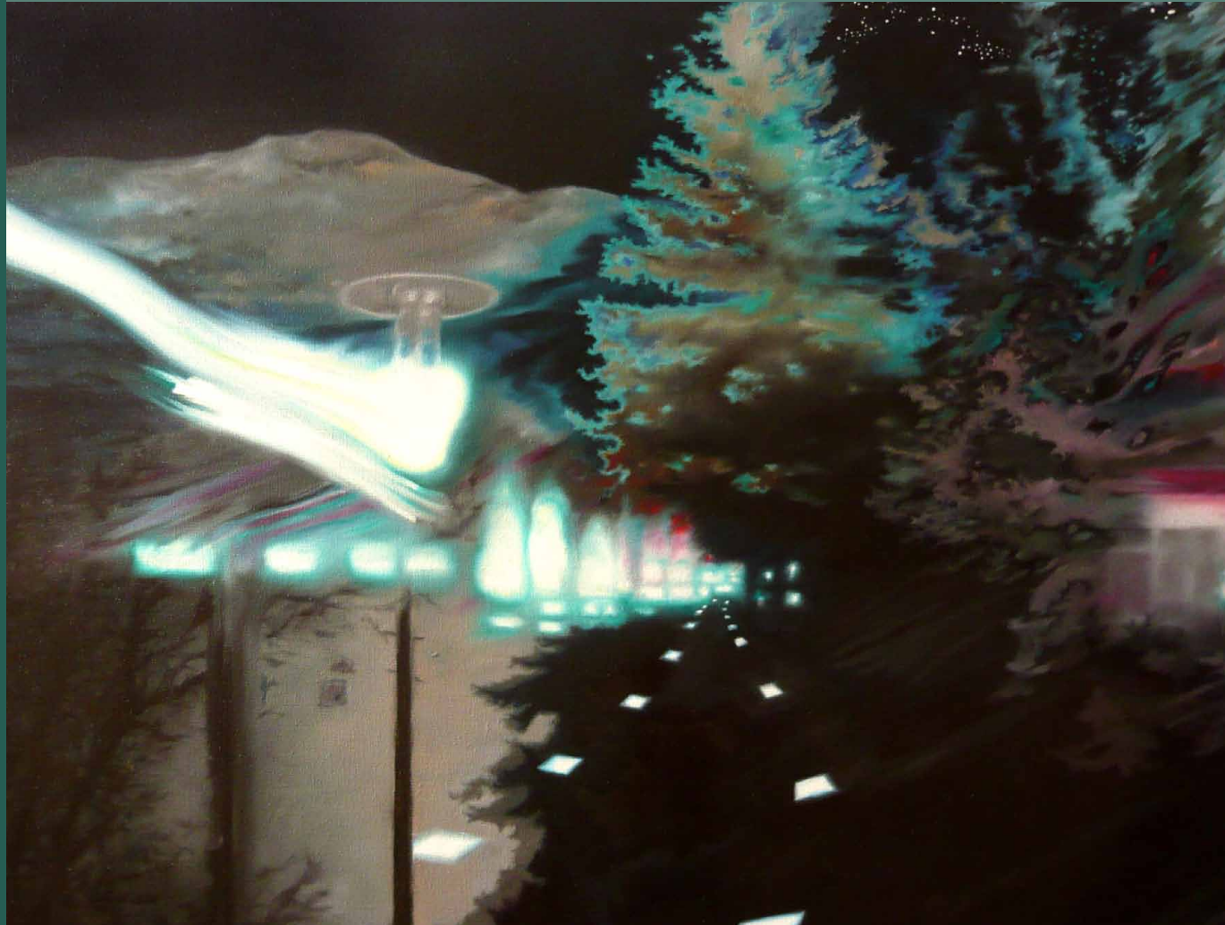
Martin Jagodzinski · Flug eines Nachtfalters 2009, 60 x 80 cm, Öl auf Leinwand