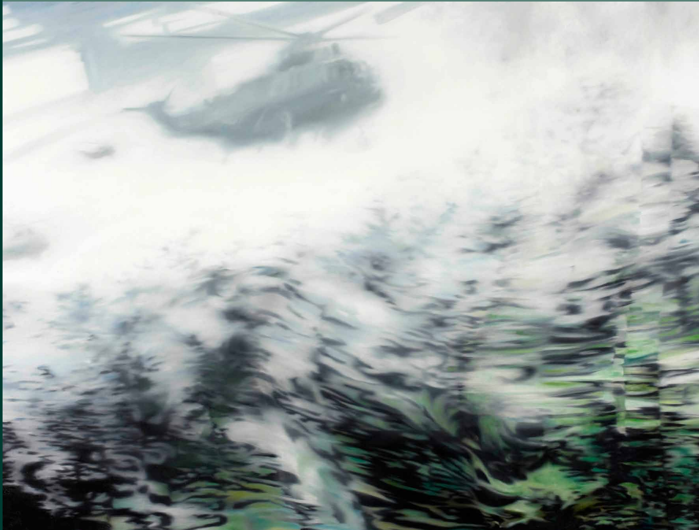
Martin Jagodzinski · Waldrand 2006, 100 x 140 cm, Öl auf Leinwand