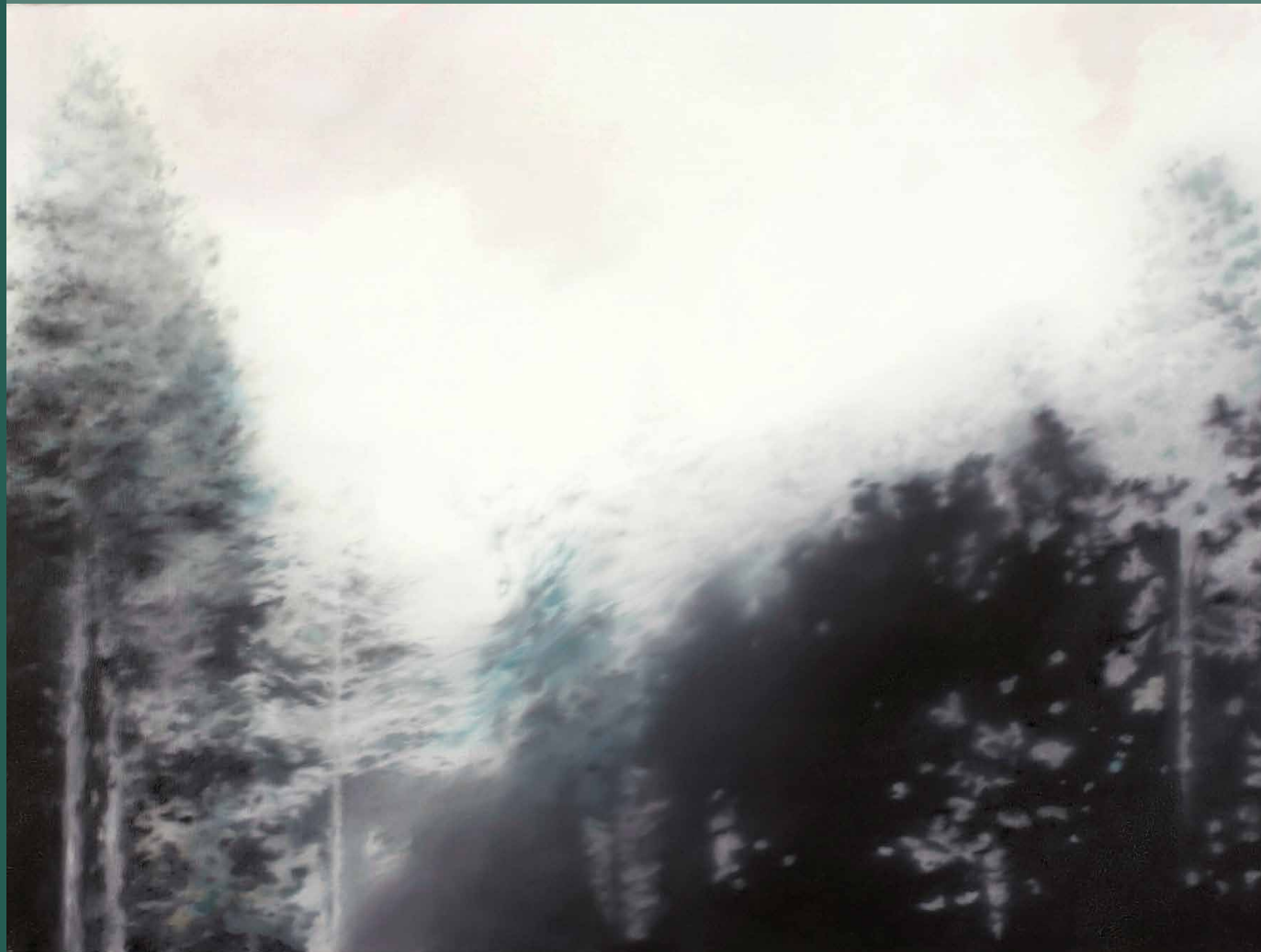
Martin Jagodzinski · Bergisches Land 2007, 80 x 120 cm, Öl auf Leinwand