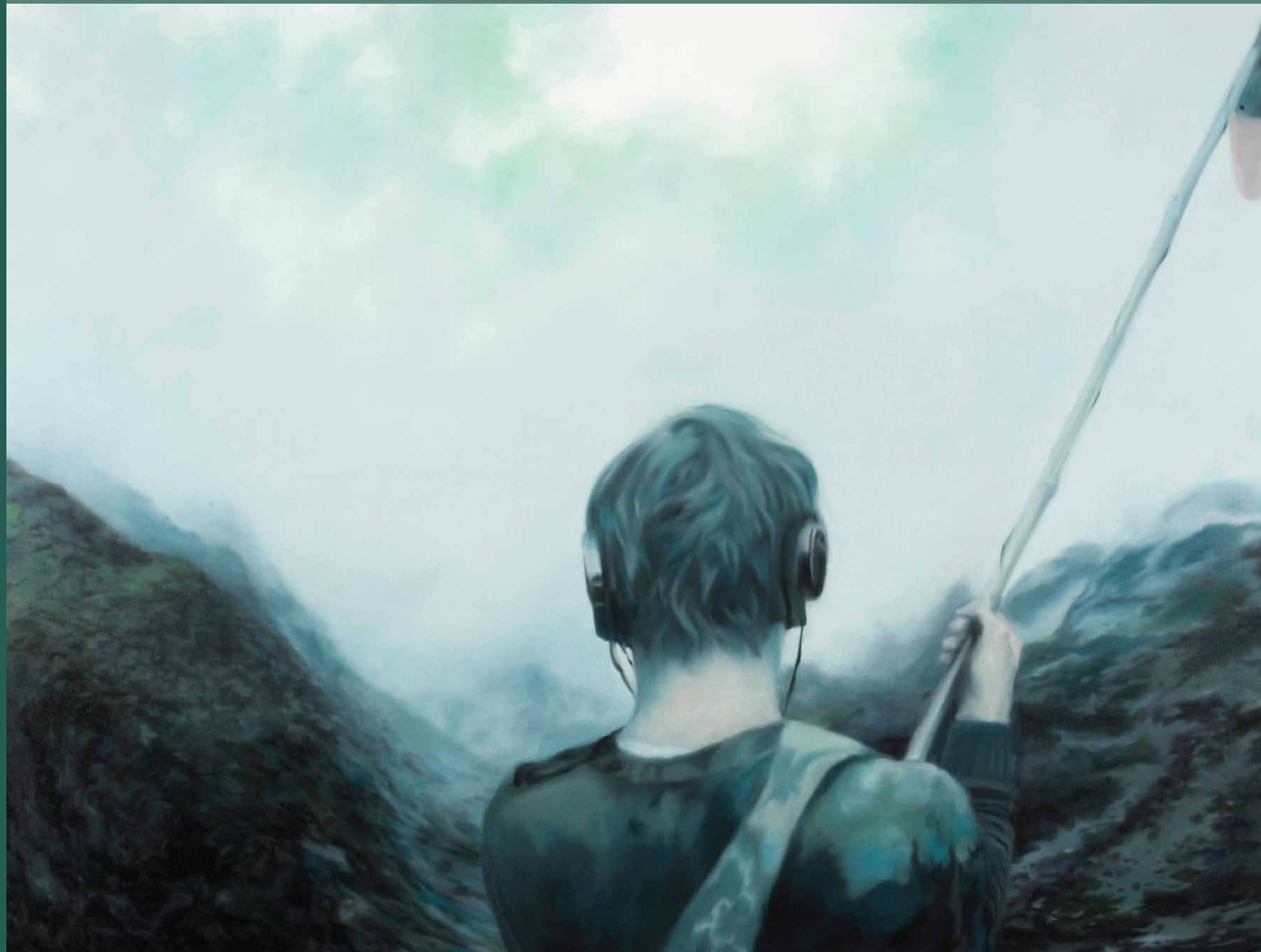
Martin Jagodzinski · Stille 2007, 100 x 140 cm, Öl auf Leinwand