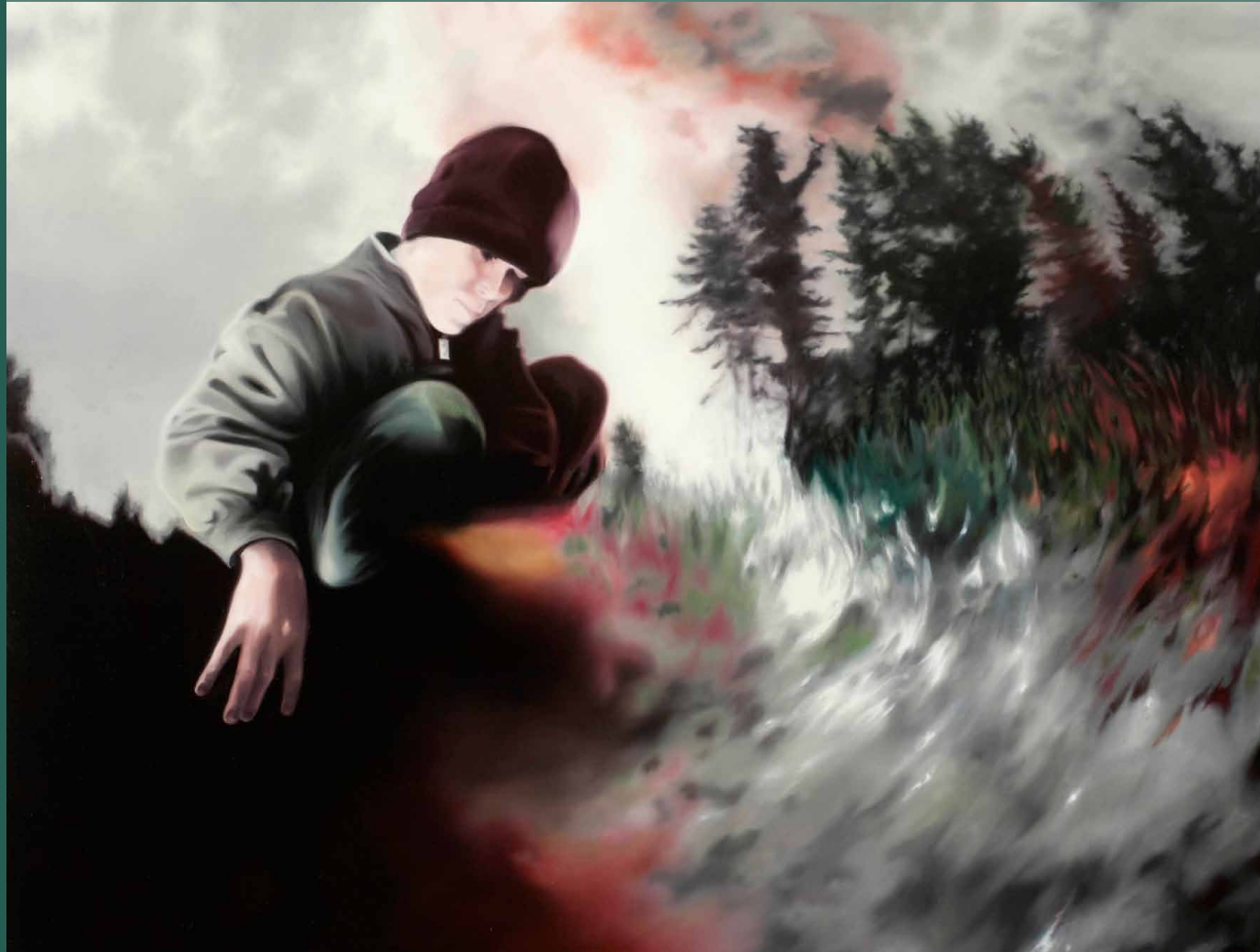
Martin Jagodzinski · Tiefe 2008, 100 x 140 cm, Öl auf Leinwand